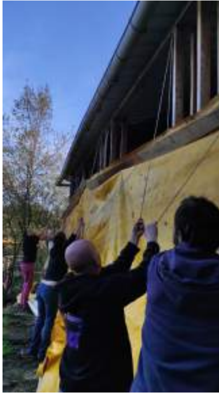
Pause de la bâche sur la cuisine

Nos projets de belle année à venir se dessinent tout autant à nos mesures : continuer sur nos lancées ! Avancer dans la construction de la cuisine, isoler la partie haute du hangar, finaliser le hangar de stockage, démarrer la construction de l'atelier bois.