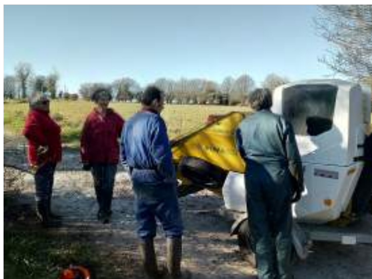
Chantier broyage