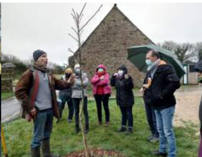
Formation taille des fruitiers

Par ailleurs, nous avons mené une enquête auprès des habitants sur leurs souhaits de modification ou d'aménagement sous forme de dessins et d'écrits. Elle a été distribuée aux habitants du bourg et mise à disposition en mairie pour toute personne souhaitant prendre part à la réflexion.