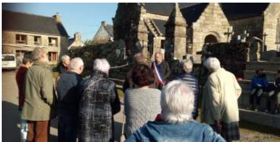
Cérémonie du 11 novembre

Depuis l'an dernier, nous avons pour projet d'organiser une « journée des assos ». Cela ne s'est pas fait. Espérons que cette année, cela sera possible.